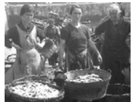
Irudiko arrain-saltzaileen pare ibiltzen ziren Amasan eta Villabonan.