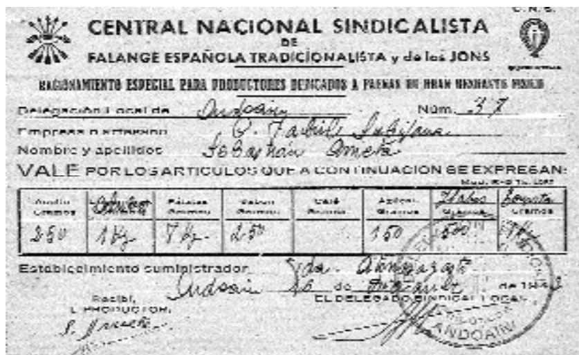
Gerra osteko errazionamendu liburuxka bat.

Familia bakoitzari, senide kopuruaren arabera, erosketarako neurri zehatz bat egokitzen zitzaion, “laurden bat olio edo bi litro olio, baina hilabete guztirako, e? Azukrea igual...”, ezin zen liburuxkan ageri zen neurria baino gehiago hartu”. Errazionamenduan hartzen zituzten jak-kiak ordaindu egiten zituzten, “pagatu egiten genituen, noski. Dohainik ez ze- goen ezer”. Banaketa neurria jakina zen,