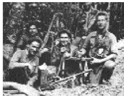
Makiak borrokarako prest.

bait. Baina herrian ez ziren sumatzen”. Makien artean espainiarrak ziren nagusi, “euskaldunak ere izango ziren tartean baina Espainiatik etorritako mutilak ziren gehienak. Guk ez genituen ezagutzen. Ez dakigu zein ibiliko zen tartean”. Irun aldean makien mugimendua handia izan zela aipatu dute, “muga inguruan ibili ziren batez ere. Han izan zen mugimendua nagusia. Armatuta ibiltzen ziren”.