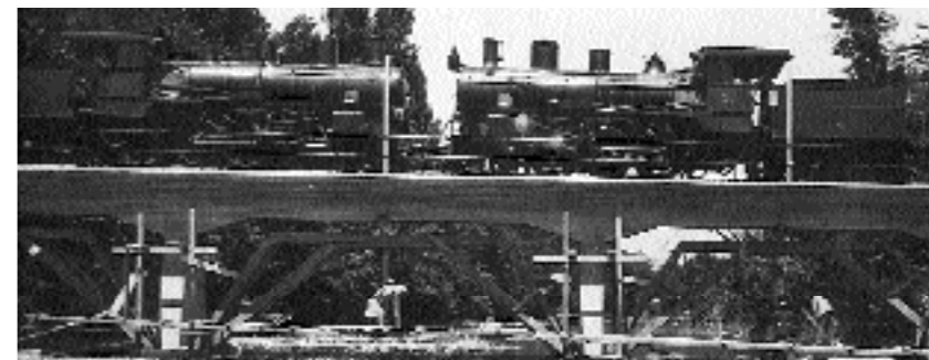
Trentxiki Andoaín zeharkatzen zuten Iruñetik Donostiara bidean.