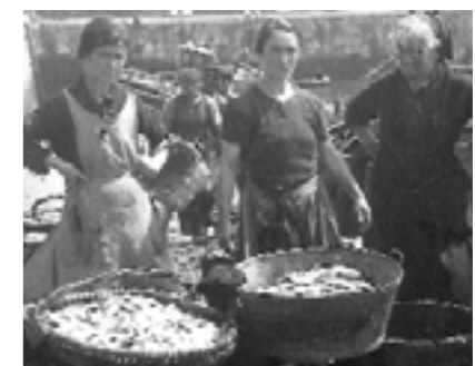
Irudiko arrain-saltzaileen pare ibiltzen ziren Amasan eta Villabonan.