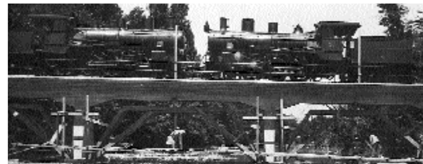
Trentxiki Andoaian zeharkatzen zuten Iruñetik Donostia bidean.