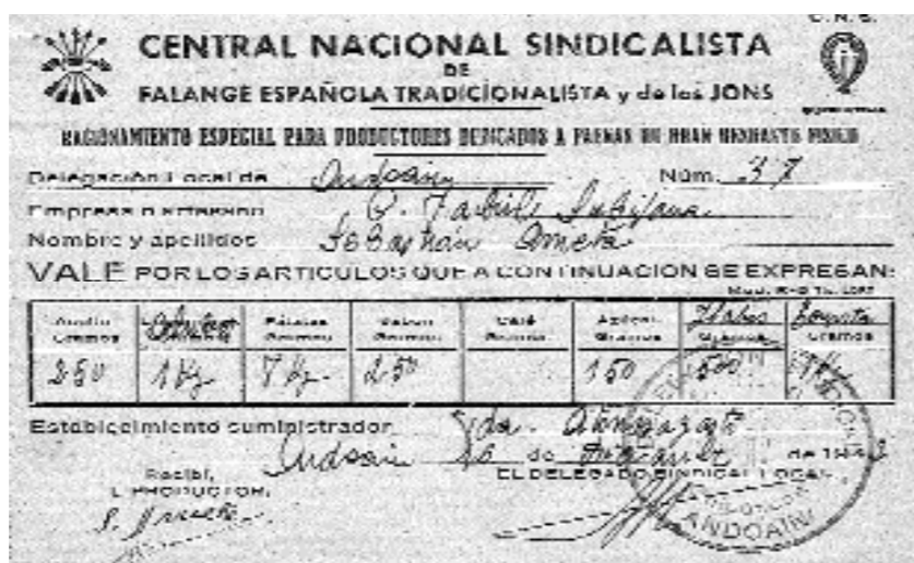
Gerra osteko errazionamendu liburuxka bat.

Familia bakoitzari, senide kopuruaren arabera, erosketarako neurri zehatz bat egokitzen zitzaion, “laurden bat olio edo bi litro olio, baina hilabete guztirako, e? Azukrea igual...”, ezin zen liburuxkan ageri zen neurria baino gehiago hartu”. Errazionamenduan hartzen zituzten jak-kiak ordaindu egiten zituzten, “pagatu egiten genituen, noski. Dohainik ez ze- goen ezer”. Banaketa neurria jakina zen,