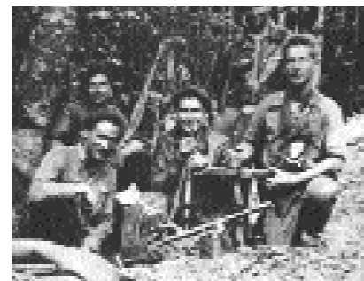
Makiak borrokarako prest.

bait. Baina herrian ez ziren sumatzen”. Makien artean espainiarrak ziren nagusi, “euskaldunak ere izango ziren tartean baina Espainiatik etorritako mutilak ziren gehienak. Guk ez genituen ezagutzen. Ez dakigu zein ibiliko zen tartean”. Irun aldean makien mugimendua handia izan zela aipatu dute, “muga inguruan ibili ziren batez ere. Han izan zen mugimendua nagusia. Armatuta ibiltzen ziren”.