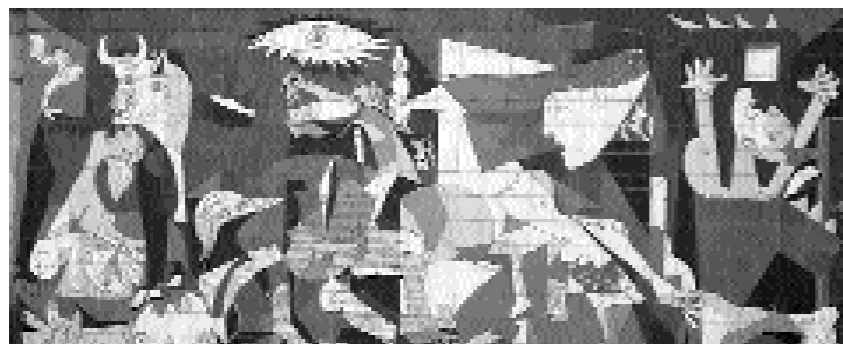
Gernikako bonbardaketan bizia galdu zuten euskaldunen omenez Picassok marraztutako lan ezaguna.

ez zen hala gertatu. Beraz, Oriotik Mundakara egin genuen ihes. Zortzi edo bederatzita urte izango nituen nik. Mundakan txoriekin afizio handia zuen lagun bat egin nuen. Niri ere asko gustatzen zitzaizkidan eta birigarro kabi bila joan ginen 1937ko apirilaren 26 hartan. Gernika aldeko mendietara abiatu ginen eta han genbiltzala, abioiak sentitu genituen. Pum eta pum hotsak entzun zitezkeen nonahi. Gure abioiak ez zirela eta Gernika bonbardatzen ari zirela konturatu ginen. Zulo batean gordeta egon ginen tarte luzean. Etxera itzuli ginenean, amak ez al dakizu zer gertatu den? , esaten zidan builaka. Nik baietz, zulo batean ezkatututa egon ginela. Hurrengo egunean Mundakako elizako plazan gudariekin bazkaldu nuela gogoratzen dut. Andoaindar bat baino gehiago zebilen han, tartean gure anaia. Menuaz ere ondo gogoratzen naiz: Anchoas a la pa-pilló .”