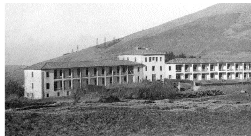
Andazarrateko erietxea bota aurretik ateratako irudia.