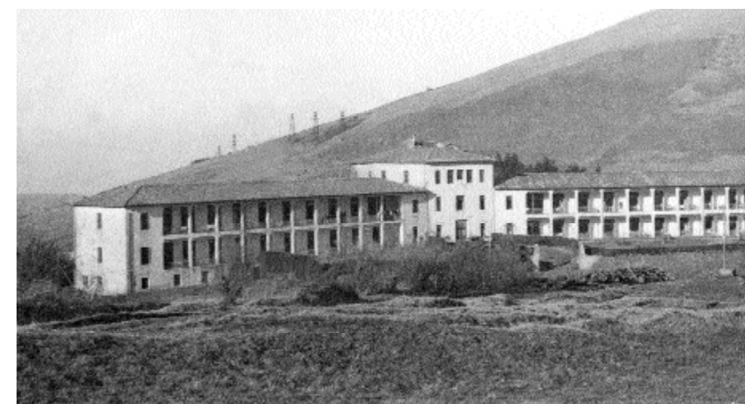
Andazarrateko erietxea bota aurretik ateratako irudia.