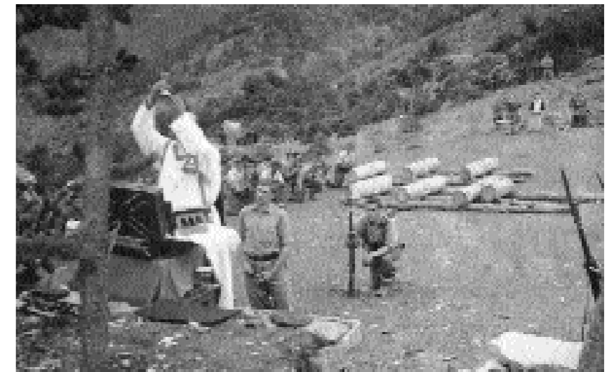
Frentean mutilei eskainitako meza.