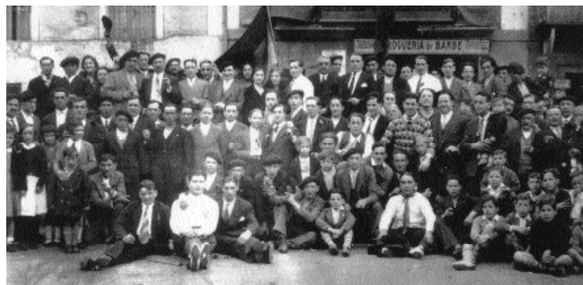
Villabonako errepublikarrak, 1934 urteko Errepublika egunean, plazan.

36ko Gerra lehertu zenean, ordea, bereizi egin ziren alderdi politiko guztiak. Errepublikaren alde egin zuten batzuek, Francoren alde besteek. Abertzaleak errepublikarrek elkartu ziren, Francorekin karlistak. Jakina, liskar handiak sortu ziren alderdien artean eta jende errugabe askok gogotik ordaindu zuen. Francoren gidaritzapean, espetxeak nahiz kontzentrazio esparruak lepo bete ziren, epaiketarik gabeko fusilaketei bidea ireki zitzaizen... Modu horretan abiatu zen horrenbeste urte iraungo zuen diktadura. Goazen, bada, poliki-poliki aurrera.