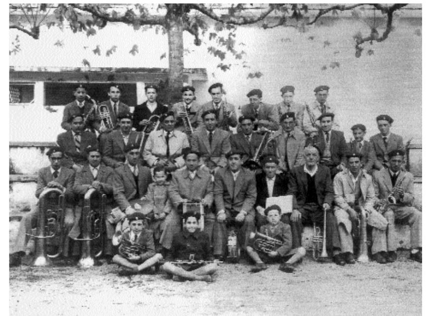
Herriko musika bandako kideak 1954 urtean.

Igandeaz gain, elizak jarritako jai egunak gaur baino ugariagoak ziren orduan. Hizlariek jai egun haiek lanegun bihurtzea pena dela uste dute. “Lehen, beste santu egun batzuen artean, San Juan eguna jai izaten zen leku guztietan”. Gainerakoan, lantokiek jai egun bat zuten, “fabrika edo langintza bakoitzaren santua egokitzen zenean, hain zuzen”. Batzuek bazkariarekin ospatzen zuten, besteek hamaiketakoarekin..., mokadurik gabe ere izaten zen ospakizunik kasuren batean.