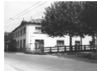
Garai bateko Gurea zinema, egungo leku berean.

Zinema Kale Nagusian izaten zen orduan. Egun lore-denda dagoen inguru horretan bazen gela bat eta hantxe biltzen ginen herriko umeak. Mairidire zuri batean ikusten genituen pelikula mutuak”. Gero-ra, 1947 urte inguruan zabaldu zen Gurea zinema, “bota zuten aurreneko pelikula, Gunga Din izan zen”, George Stevens-ena. Solaskide ia guztiak ikusi bazuten ere, ez dira bat etortzen lantzen zen gaia zehazterakoan; hala ere, gogoan dituzte filmeko gerrateko irudiak. “Pelikulan zehar, asto zuri bat agertzen zen gerrako materiala eramaten. Amasar asko zegoen zineman eta norbaitek broman, ‘Hara, Uxamendiko astoa!’ esan zuen ozen. Uxamendiko asto zuria etorriko zitzaion bururo. Algara ederrak entzun ziren zineman”. Hogei urte inguru zituzten solaskideek orduan. Zinema igandero zabalitzen zuten arratsaldeko 17:00etan eta ahal zuten emanaldi guztietara joaten ziren taldekideak, “bazkaldu, sukaldeko lanak korrika batean egin eta bost senide joaten ginen zinemara” gogo-