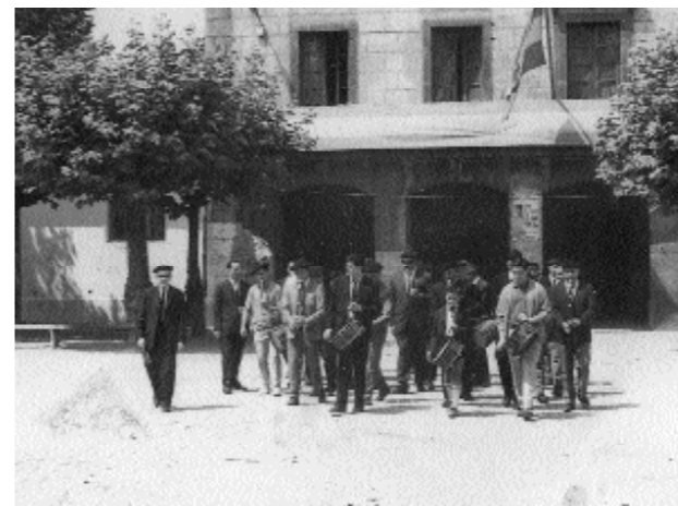
Santio jaietan txistulariak Villabonako kaleak zeharkatzen.

"Tabernak eta elkarateak ere baziren. Guzti-guztiak ez ginen hain goiz erretiratu baina, goizean jaiki..., bai azkar!"