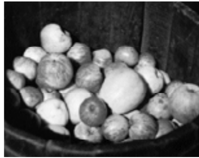
Sagar helduberrien uzta goxoa.

Ardoa egun berezi-berezietako bazkarietan soilik edaten zuten. “Ardoa gutxitan aterako zen mahaira, ondo gordeta izaten zen”. Gainerakoan, pitarra gehienetan, “lehen sagarrarekin egindako sagardoari deitzen zitzaion pitarra. Aurreneko sagardoari. Hari ur dezente botatzen zitzaion. Gero, barrika hasi eta sagardo ona izaten zen hasieran, baina, barrika jaisten ari zen heinean, gazitu egiten zen sagardo. Ura botatzen zitzaion gozatzeko. Huraxe zen pitarra”.