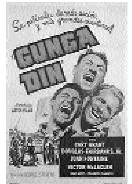
Gunga Din filmeko kartela.