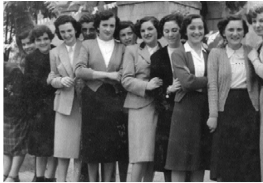
Villabonako neska gazteak eliz-barrutiaren irekieran, 1952 urtean.