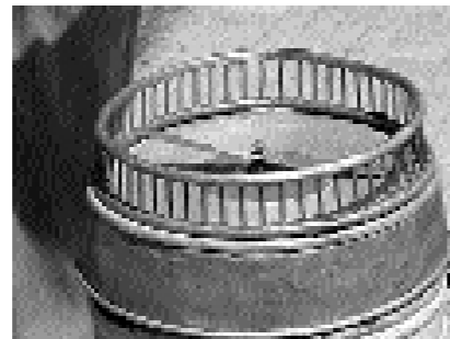
Barkilleroek antzeko erruleta erabiltzen zuten zozketa egiteko