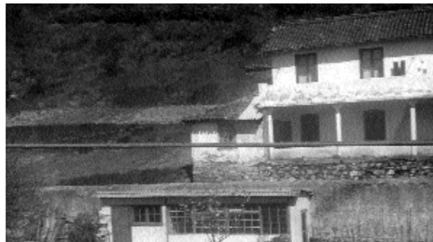
Barriola etxea, Urdapilleta etxearen atzean zegoen kokatuta. Jauregitarrak bizi ziren han. Oiloak zituzten, baita soroa ere. Argazkiko baratzea Urdapilleta etxeok gobernatzaren zuten. Etxea eta baratzearen artean, egun ere bizirik dagoen bidea. Barriola etxearen atzealdetik jarraitzen zuten Malkarrak.