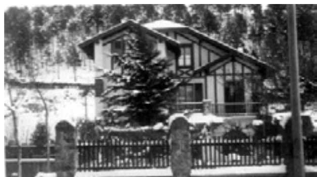
Urdapilleta etxearen atzean, bide elurtuan, ongi baino hobeto irudikatzen da Malkarra.