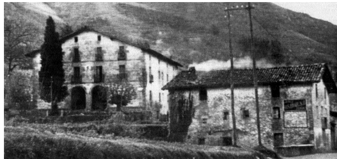
Errekaren alboan Sorredore errota. Atzeraxeago, Etxe-Ondo