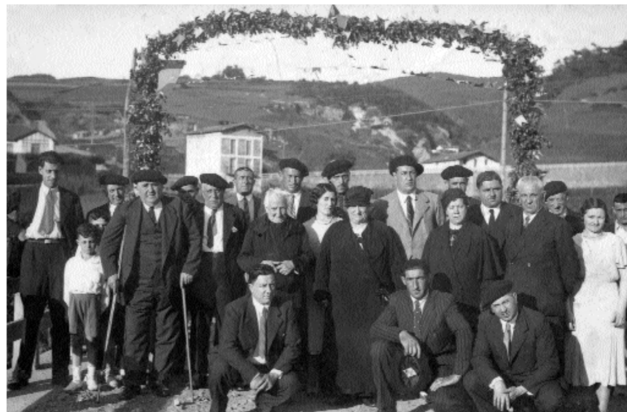
Sacemgo zubiaren inaugurazioa, 30eko hamarkadako lehen urteetan.