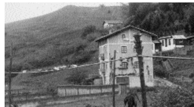
Ormazabaldarren baratzea eta Sorrondegi aroztegiaren atzealdea ageri dira irudiko zelaian. Aurrerago, Amenabar etxea. Goian oilategi lanetarako erabiltzen zuten etxola. Goraxeago Malkarra; inguru horretan zegoen bidegurutzea: Txermin aldera edo Arratzain aldera jotzeko aukera.