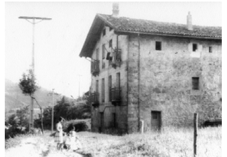
Ubare baserria duela urte asko bota zuten