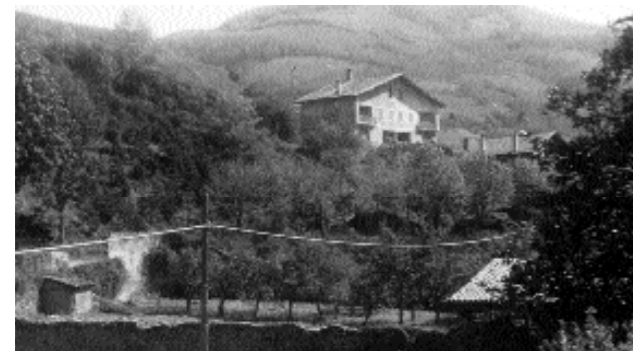
Garate etxearen aurrealdea ageri da argazkian. Garatetarrak bizi ziren bertan. Saizar etxearen baratza azpialdean ageri da, ondoan txabola duela. Harresiaren bestaldera, peretzarren baratzea; ondoan, garai bateko magnolio ederrarekin. Zuhaitz artean, Malkarra pasealeku; bide zelaia, laua.