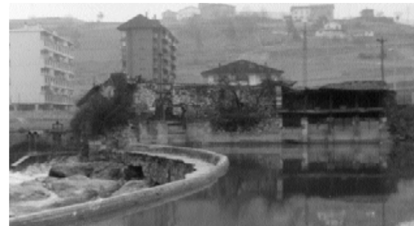
Oria ibaiari itsatsita, Arroa errotaren arrastoak.