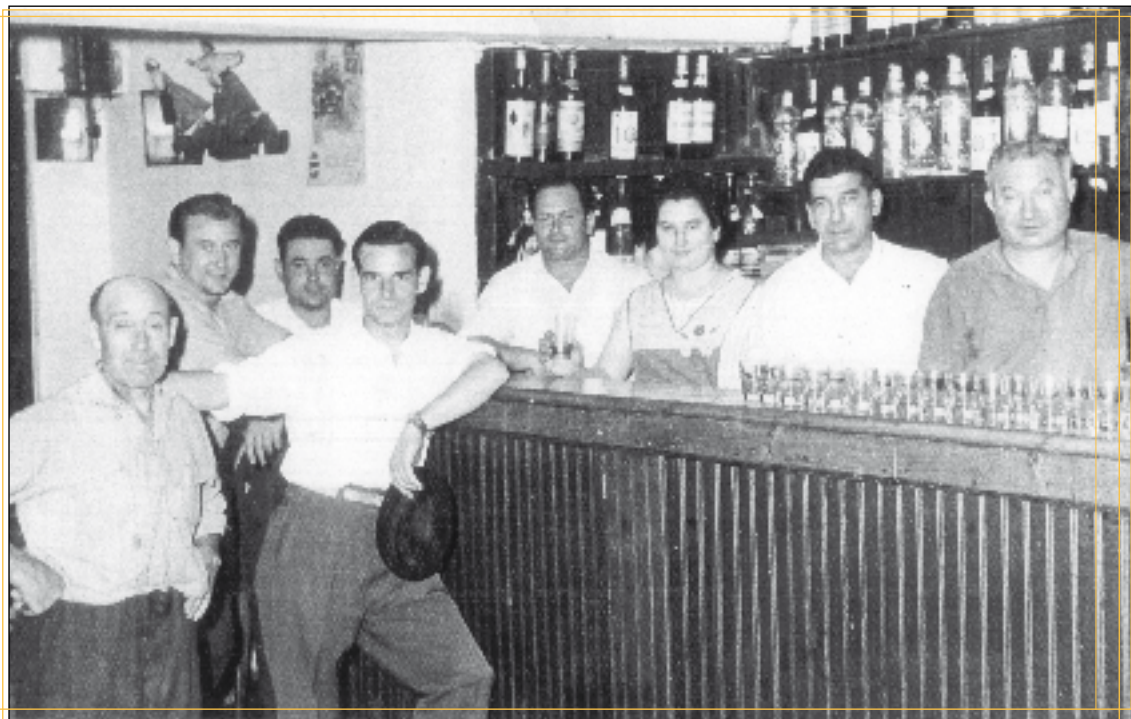
Kale Nagusiko Turko tabernan, tabernariak eta hainbat bezero.

1 6. zenbakian garai bateko dendak, tabernak eta sagardotegiak izango ditugu mintzagai. Kokapenez gain, dendarien edo tabernarien izenak zehazten ere saiatuko gara eta noski, zer saltzen zuten, ze giro sortzen zen, nolako saltokiak ziren... Tratua zuzeneko zen, saltzailearengandik bezeroarengana eta alderantziz. Gai polita, ezta? Gu bezainbeste erakartzen bazaituzte, itxaron pixka batean; hurrengo hilean izango duzue giro haren berri.