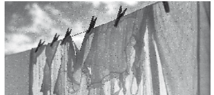
Arropa zuria zintzilik.

Egun baino arropa aukera gutxiago izanagatik, orduan ere, pilatzen zen arropa erabilia. Arropa garbitzea errito modukoa zen. Kale etxeetakoek garbilekuetara jotzen zuten. “Etxean beratzen jartzen genuen arropa eta jabatu egiten genuen. Gero garbilekura joaten ginen uretan pasatzera. Emakume gehienak baldea buruan hartuta joaten ziren”. Mugimendu handia sortzen zen garbilekuetan, “orain jubilatuta batzuk ibiltzen dira, ba, denbora pasa? Modu hartan joaten ziren batzuk garbilekura, kontuak esanez tertulia egitera. I-ji-ji eta a-ja-ja, algara ederrak entzuten ziren”. Villabonan bi garbileku zeuden, Berdura Plazan nagusia eta Subijana baino aurreraxeago txikia. “Berdura Plazakoak burnizko ate handia zuen eta giltzarrapoarekin ixten zen. Goiz eta arratsalde irekitzen zuten arduradunak”. Baserrietan lixiba egiten zen,