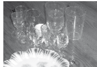
Sagardoa nahiz pattarra edo koñakarentzako edalontziak.