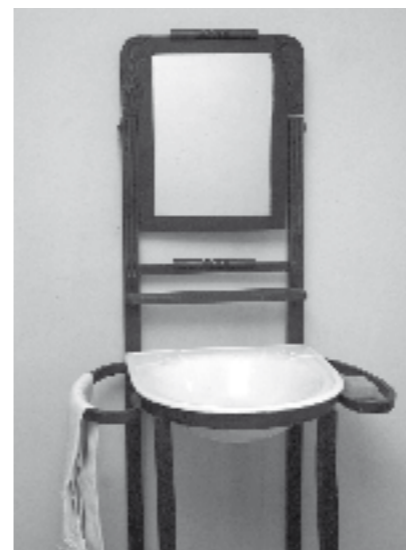
Lababoa, harizko eskuoihal eta guzti.

Logela bakoitzean pare bat ohe izaten zen eta, anai-arreba txikienek, ohe berean egiten zuten lo, "ez pentsa, oraingo ohe handiak baino txikiagoak ziren haiek". Hiru bat logela izaten ziren guztira, "kalean nahiz baserrietan gela asko gortinekin bereizten ziren, aterik gabe. Alkobak esaten zitzaion". Arropak gordetzeko ez zuten armairurik, "armairurik ez, komodak erabiltzen genituen guk. Baxuak ziren eta txikiak, ispilurik gabeak. Orain adinako arroparik ez zenez, ez geneukan leku arazorik". Etxe eta baserri gehienetako logeletan, garbiketarako lababoa izaten zen,