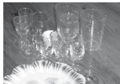
Sagardoa nahiz pattarra edo kofiakarentzako edalontziak.

galbahean pasatutakoa, fin-fina. Bitartean, ura xaboiarekin berotzen jartzen zen pertza batean, laratzean zintzilikatuta. Erramu pixka bat ere gehitzen zitzaion. Urak irakiten zuenean, goitik behera botatzen zitzaion kuelari eta ura beheko zulotik ateratzen zenean, balde batean jasotzen zen. Pauso horiek eman bitartean, berriz ere, irakiten egoten zen beste pertza bat eta, berriro ur parrastada botatzen zitzaion goitik behera. Beheko zulotik ur beroa ateratzen zenean, lixiba egosita zegoela esaten zen. Gau batean bere horretan uzten zen, hurrengo egunean uretan pasatzeko”. Zer iruditzen? Erosoago moldatzen garelako gaur, ezta? Eta sutako