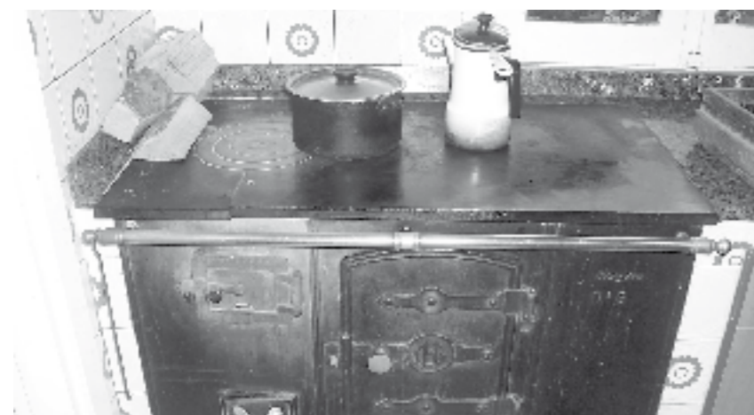
Jaki goxoak prestatzeko su beroa ekonomikan.

izaten zuen. Hura altxa eta komunaren funtzioa betetzeko, pixontzia zeukan barruan. 'Silla-komuna' deitzen zitzaion eta gaixo zeudenek edo ezinduek erabiltzen zuten". Eserleku berezi haren erabilera oso garrantzitsua zela diote hizlariek, "bat edo beste ohean geratu baldin bazen eta, komuna etxearen bigarren solairuan bazegoen, 'silla-komuna' erabiltzen zen. Orain ere, kasu askotan ez litzateke gaizki etorriko; gaixo dagoenak nonbait egin behar baititu eginbeharrak". 'Silla-komuna' pieza bakarrekoa zenez, batetik bestera garraia zitezkeen, "logelan, egongelan nahiz sukaldean, nahi zen lekuan jartzen zen. Gainera, komuna erabili behar ez zenean, aulki modura ere erabili zitezkeen". Batzuk atzetik irekiak ziren, baldea edo pixontzia jarri eta kentzeko. Beste kasu batzuetan, dena itxia izaten zen eta gainetik aldatzen zen, tapa altxatu eta gero. Dutxarrik ez zegoen, ez kalean ez baserrian. Balde batean ura hartu eta sukaldean garbitzen ziren ahal zuten bezala. "Dutxatu ez, garbitu egiten ginen. Akordatzen naiz barrinoin handi bat hartu eta, txikienetik hasita, errenkan nola garbitzen ginen xaboiarekin. Ohera joaterako, ur epelarekin, oinak garbitzen genituen gure etxean behintzat" azaldu du Encarnak.