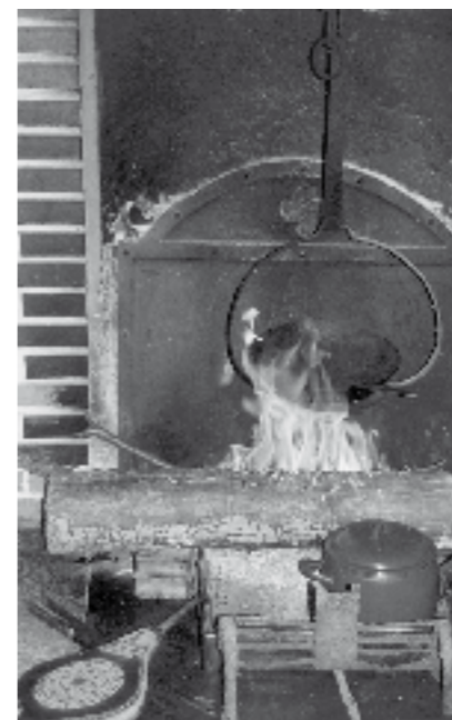
Behiko sua, Pasu baserri-ian. Laratza, neskamea, talo-mantendua eta hauspoa ere ageri dira.

SUKALDEA: Sukaldea zen, zalantzarik gabe, baserri-ian gune garrantzitsua, bizilekua zen. Mahai handi bat izaten zen eta baita zizellua edo eserleku luzea ere. Biak gora jasotzen ziren maratila baten laguntzaz, paretari lotuz. Modu horretan, sukaldean leku asko geratzen zen libre. Hala ere, lanak egin ahal izateko, mahai txikiago bat ere izaten zen. Sukaldean urrik ez zuten garaian, herriko iturrietatik sullan ekartzen zuten ura. Egurrezko ontziak ziren, erdian zilar koloreko uztai bat zutenak. Sullak apaletan gordetzen zituzten, ura behar zutenerako. “Guk ez baina, gure amek, buruan ekartzen zituzten sullak, zuzen-zuzen”. Apalez betetako armairu bat ere izaten zen sukaldean, tresnak gorde ahal izateko. Mapiilla ere sukalde gehienetan izaten zen, talo-orea egiteko mahai berezia zen: Arto-irina gordetzeko eta orea zanpatzeko erabiltzen zen. Platerak eta ontziak lehortzeko, egurrezko sukadera izaten zen eta hozkailurik ez zen garaian, freskera ere bai. Leihorearen kanpoaldera kokatzen zen freskera, pareta bat sarekoa zuen eta bestea, jakiak hartu ahal izateko atea zen. Bezperako jakiak edo haragia gordetzeko erabiltzen zuten. Kan-