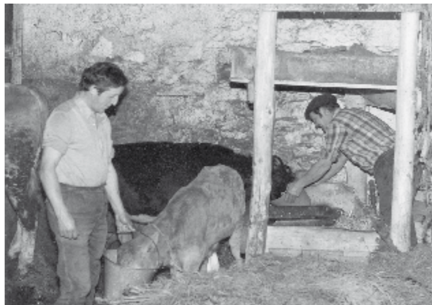
Ukuiluan baserritarrak txekorrei esnea ematen.

GANBARA: Tresnak gordetzeko erabiltzen zen, batik bat, ganbara edo mandioa. Mandiora igotzeko bideari, mandioko zubia esaten zitzaion. Hainbat solaskidek belarra lehertzeko ere erabiltzen zuten. Beste batzuek, ordea, sabaian zabaltzen zuten belarra, artoa eta bestelako barazkiekin batera. Sabaia, ganbara gehienek zuten bigarren solairuari deitzen zitzaion. Hainbat baserrik etxe-aurrekoa izeneko borda ere izaten zuen. Kasu horretan, bertan gordetzen ziren lanerako erremintak eta lehortutako belarra ere hantxe jasotzen zen.