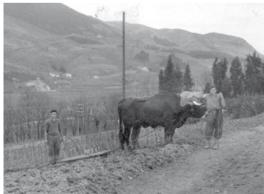
Baserritarrek arrearekin lanean, Amasako Mutteiko belazeetan.

la nabari zaie, "asko erabiltzen genuen atxurra" diote. Atxur txikiekin ere aritzen ziren lanean, jorraiekin. Belarra biltzeko eskuareaz baliatzen ziren eta mozteko sega erabiltzen zuten. Patata ateratzean, fruitua gutxiago zulatzeko, hozpikua erabiltzen zuten (hortz bikua).