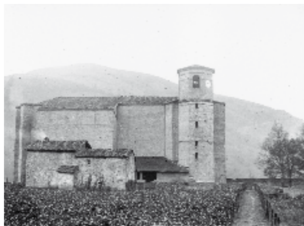
Elizaren parean, Seroetxe-zar. Baserriaren atzealdeko ikuspegia ageri da argazkian.