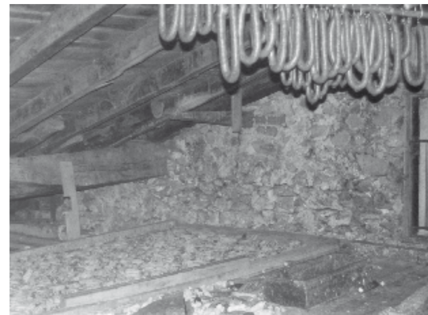
sabaian, artoa eta patata lurrean. Txorizoak zintzilikatzen.

gainean, urdai-azpikoa, pieza loditan ebakita. Gatzarekin ondo estali eta gero, beste zatiak gehitzen ziren gainean; solomoa edo saiheskia... Gatza berrituz, ondo zaindu behar izaten zen". Neguan ederki mantentzen zuten haragi gazitua. Udaberria arte irauten bazuen, gehiago zaindu behar izaten zen, beroarekin batera, elbia etortzen baitzen. Piper-hautsa gehitzen zioten gatzari orduan.