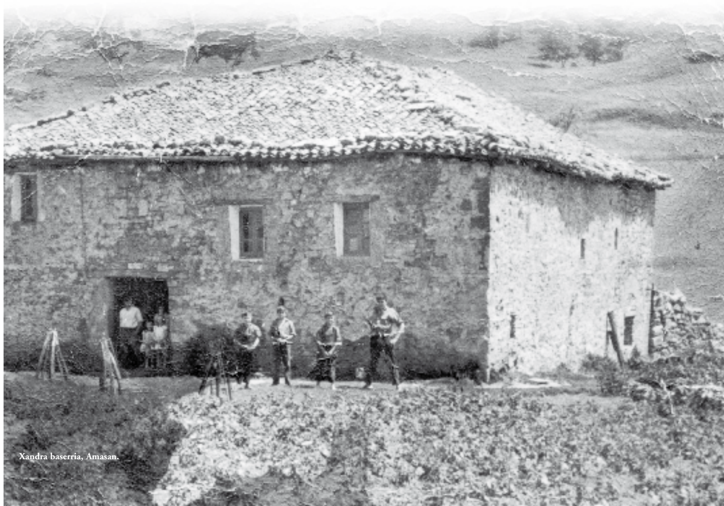
Xandra baserria, Amasan.