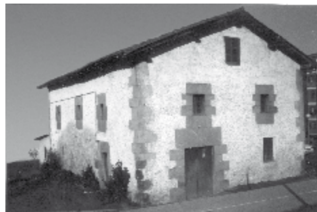
Amasaetxe baserrria, Larrea auzoan, duela urte gutxi, eraberritu aurretik.