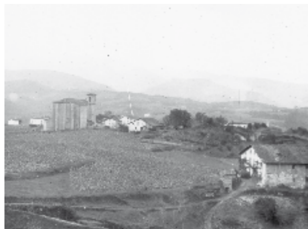
Arantzalde baserrria goian. Elizaren ondoan, Amallu, Seroetxe eta Frantsesenea. Atzealdean, berriz, Eguzkialde baserrria eta Santa Krutz ermita.