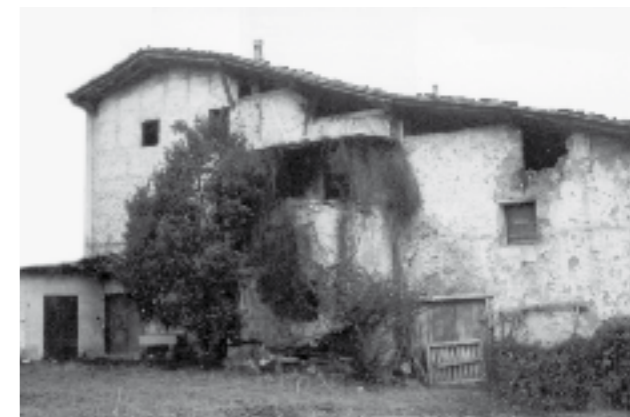
Agaraitz-zar baserrria, Villabonako sarreran dago, Agaraitz auzoan.