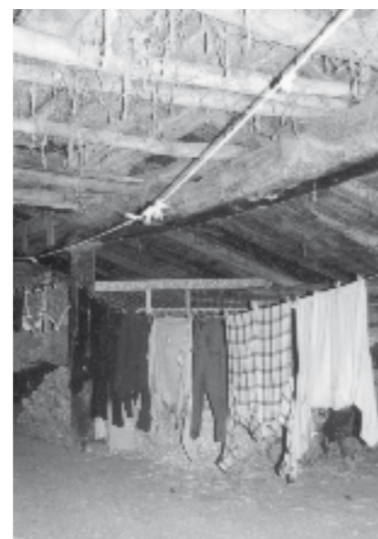
Ganbaran arropak lehortzen; gainean, sabaia.

"Gaur adinako arroparik ere ez zen orduan, lanerako arropa bat eta aldatzeko beste bat"