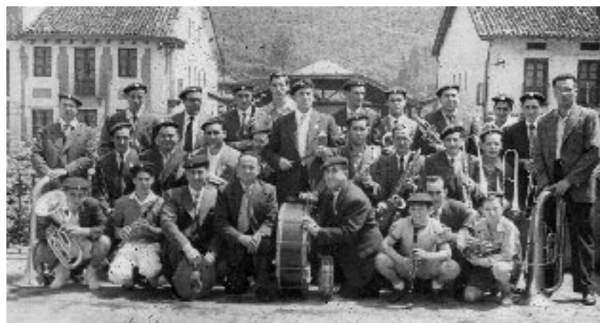
Musika banda, 1958 urteko Santa Zezilia egunean, udaletxeko terrazan.